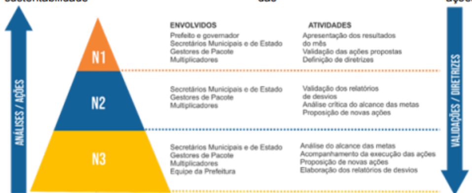
Pirâmide de Acompanhamento

Complementarmente, o modelo estruturado de governança compartilhada do Programa Juntos promove a interação entre diferentes atores sociais e a constante troca de informações e conhecimentos por meio das Reuniões de Governança – encontros trimestrais, de nível estratégico (N1), que reúnem líderes empresariais locais e da governança com lideranças públicas. O objetivo é acompanhar os resultados alcançados no período e pactuar diretrizes para o futuro, fortalecendo a convergência de esforços e a sustentabilidade das ações.